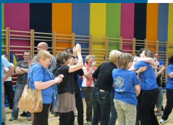
Druženje ob sportu je med članicami in člani zelo priljubljeno.

nostih dobrodošlo in da bi v prihodnje težko našli razlog, da tega športnega dogodka ne bi organizirali. Prihodnje leto tako vabljeni na pete športne igre SVIZ na Obalo.