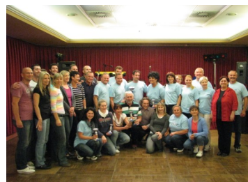
Športne igre SVIZ 2012 bodo potekale v organizaciji OO SVIZ Obala.

Na spletni strani www.sviz.si si lahko ogledate nekaj videoposnetkov z iger in galerijo slik.