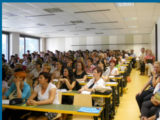
Prvi regijski posvet za izboljšanje bralne pismenosti učencev v Murški Soboti presegel pričakovanja. Več kot 130 udeležencev.