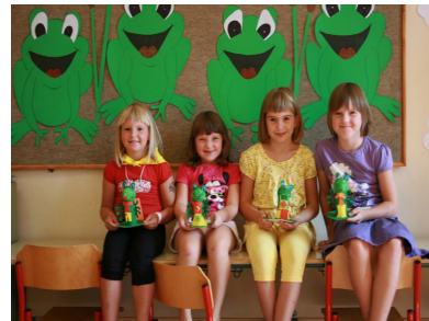
Učenke PŠ Šmarje na Vipavskem na prvi šolski dan (več fotografij v sklopu zgoraj omenjene novice na www.sviz.si ).

V Sindikatu vzgoje, izobraževanja, znanosti in kulture Slovenije želimo vsem učiteljem, vzgojiteljem in drugim zaposlenim v vzgoji in izobraževanju uspešno šolsko leto 2011/2012.