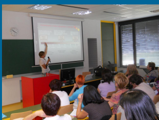
Podobni regijski posveti bodo sledili januarja in februarja 2012.