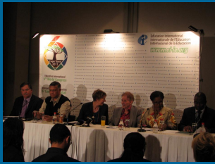
6. svetovnega kongresa EI se je udeležilo več kot 1.600 delegatov in delegatov.