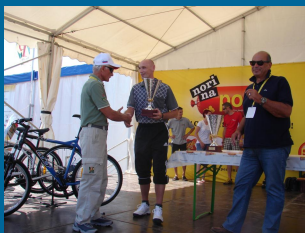
Skupina kolesarjev SVIZ je prejela pokal za drugo najštevilčnejšo ekipo na maratonu.