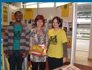
Predsednica SVIZ je organizaciji Equal Education v imenu sindikata izročila dve knjigi.