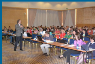
Več fotografij z izobraževalnih seminarjev si lahko ogledate na spletni strani www.sviz.si .