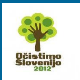
Ob koncu letošnjega marca se bo tudi SVIZ kot partner projekta pridružil največji okoljski akciji v zgodovini človeštva.