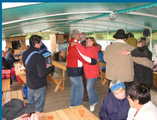
Upokojeni člani SVIZ so se preteklo jesen družili ob potopepanju po Novem mestu in okolici.